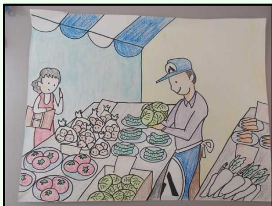
絵を見てお話をつくりましょう

玉川学園は、「お話をする力」「聞き取る力」「ひらがなを読む力」を求めています。絵を見てお話を作ったり、面接では次々とお子様に質問されます。この講習では、言語の力をつけるために、動詞・形容詞をたくさん使ったお話作りや、ひらがなを読んで文章を完成させる課題を行ないます。その他に、積み木の数・かくれた数・お片づけなどの出題傾向に合わせて徹底的に行います。